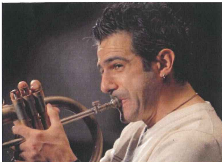
Paolo Fresu (di Elio Guidi)